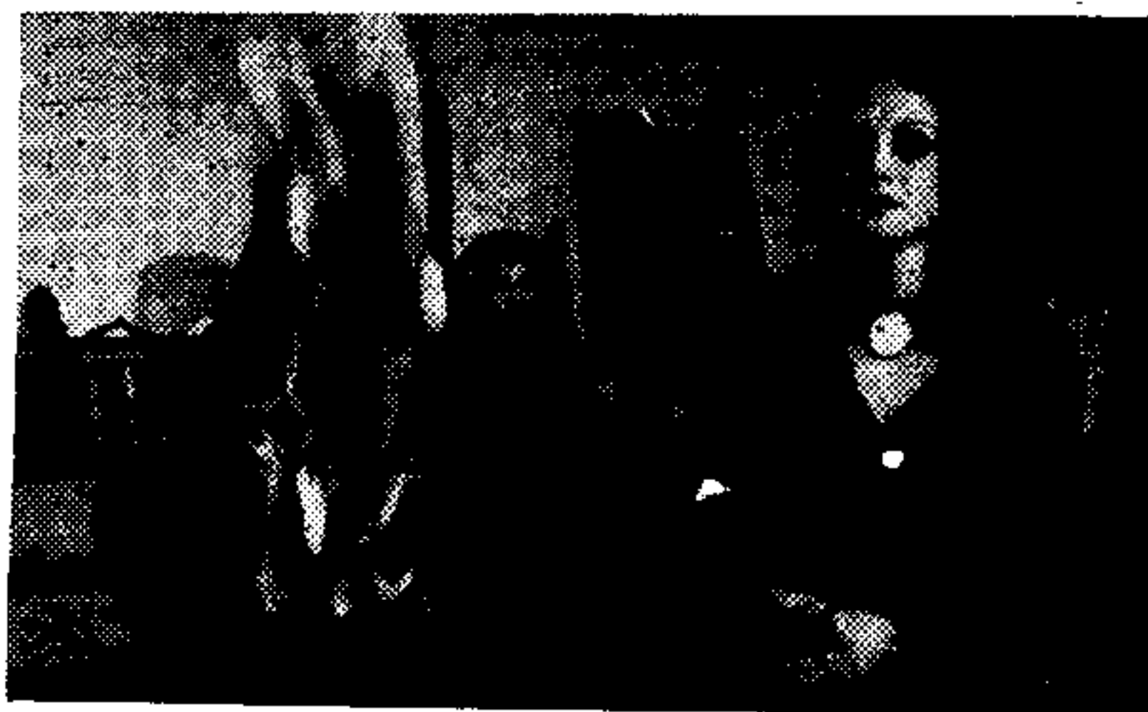
左圖：撒但會一女祭師，揮劍燒符咒，作法施術與中國的道士一模一樣。