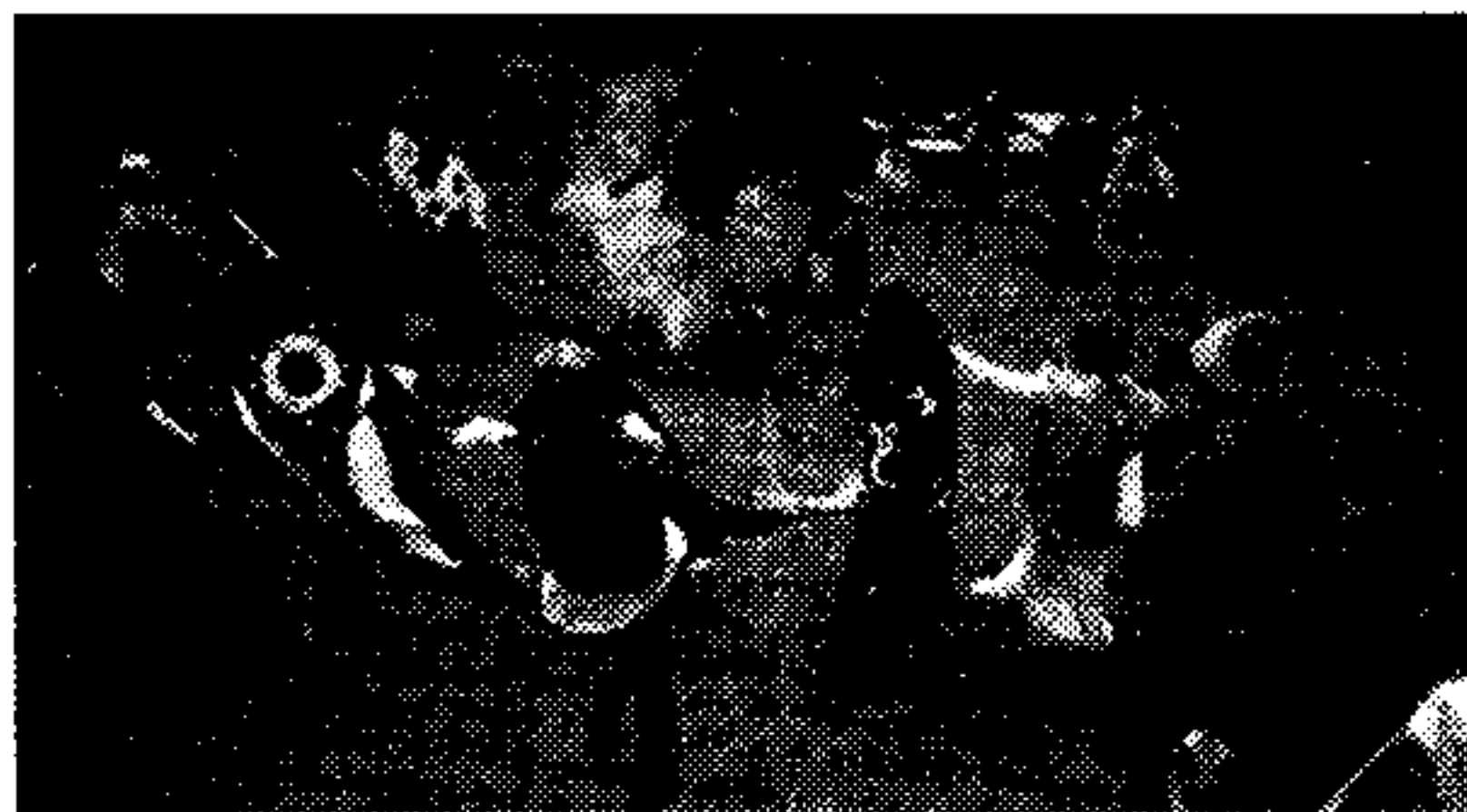
上圖：極端靈恩派份子，在郊外狂舞慶祝巫術節期。