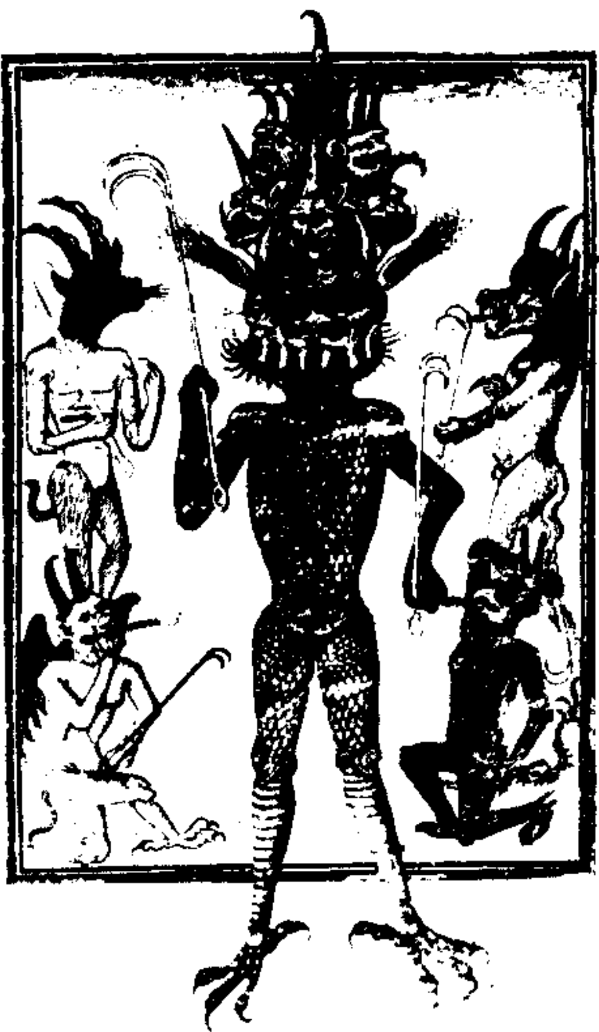
左圖：中世紀時代羣魔畫像

總之，這是太空時代，也是人心「太空」給魔鬼留地步的時代，這是個離經叛道的時代，也是「鬼附」的時代。從前迷信鬼神的大都是村夫愚婦，現代卻反過來盡是一些大學生，知識份子，專家，教授，這是時代的悲劇，也是時代的逆流，更是末世時代必有的現象。