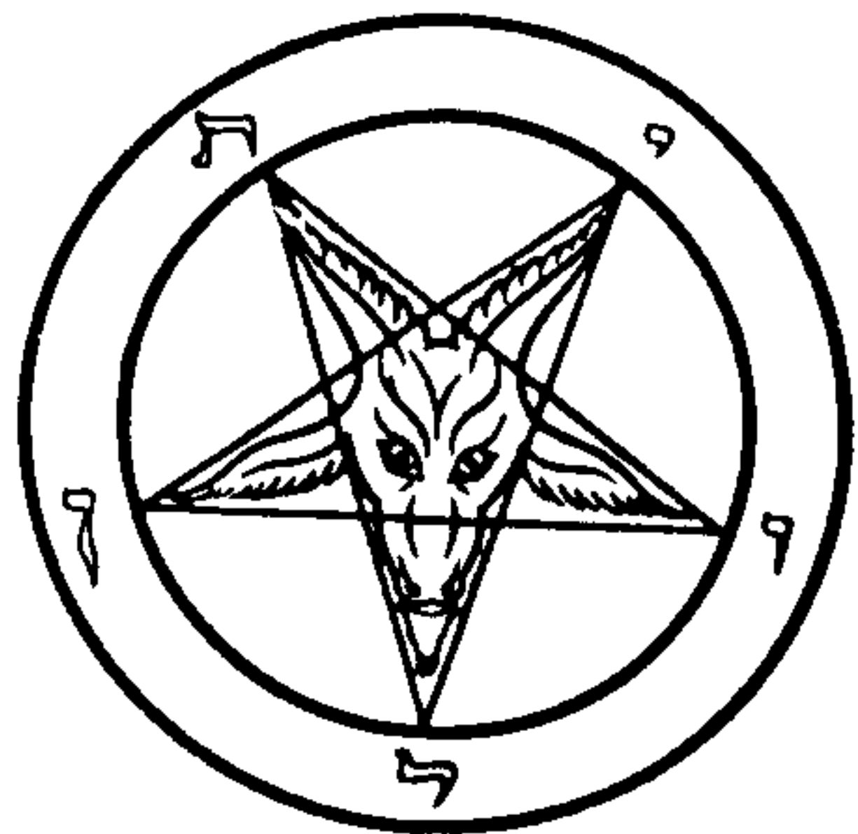
右圖：撒但會神秘的標誌，正面看如凶惡的山羊，反過來看乃更可怕的一鬼臉。