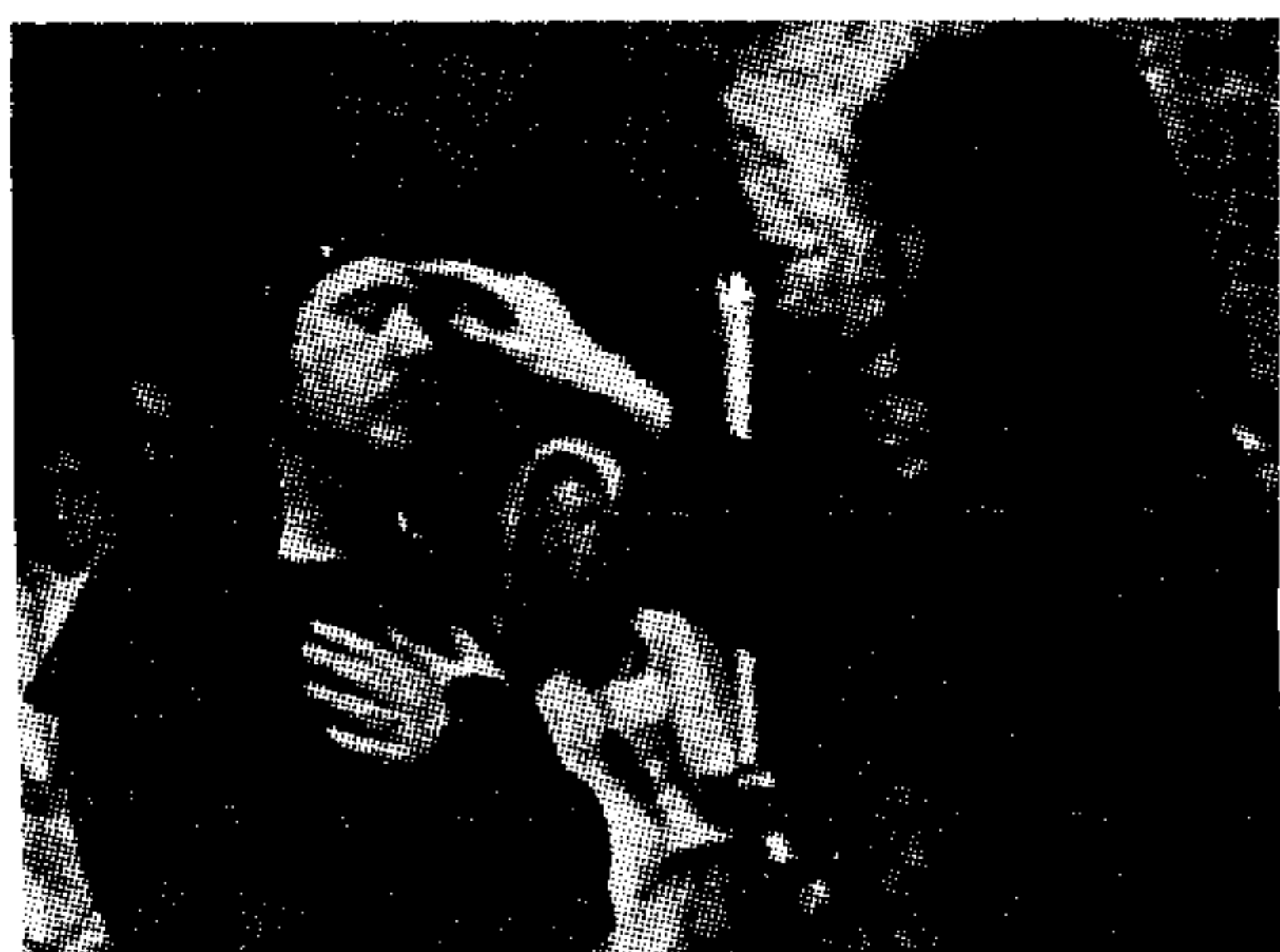
下圖：撒但會一位男信徒受女祭師封立為男祭師的點額禮儀。