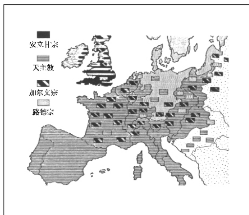
16 世纪末宗教区域划分图

新教徒教导说宗教权威是惟独圣经。这次公会议则坚持罗马教会即教宗和主教至高无上的训导职分，认为他们是圣经绝对必要的解释者。