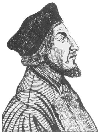
约翰·胡斯(1369—1415年),捷克改教家,认为基督——绝非教宗,才是教会的元首。

后,才接触威克里夫的宗教著述。他马上接受了这位英格兰改教家的教会观,即教会是蒙神拣选者的团体,基督而非教宗是教会真正的元首。