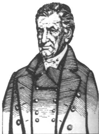
莱曼·比彻(1775—1863年),清教徒,对美国基督教化持有坚定的信念。

“在大斗争中,”林肯曾说;“每一方都宣称自己是遵行神的旨意。双方都有可能对,但其中一定有一方是错误的。”还有一次——在他第二次就职演说中——他提到:“双方(支持联邦政府的各州和南部邦联 ① )都查考同一本圣经,向同一位神祷告;各自都祈求他的帮助以击败对方。……双方的祈祷都不可能蒙应允。……全能的主有他自己的目的。”林肯明白,人必须尽力成就神的旨意,同时也能够为自己做出决定,但全能者的目的始终高过人自己的计划。