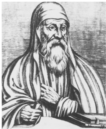
奥利金(185—254年),伟大的亚历山大教师,一直认为阐述圣经是其首要任务。

光明,正如我们的肉体需要食物,同样,我们的心智……自然渴望认识神之真理和我们所观察到的一切之背后的原因。”