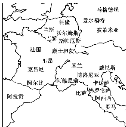
中世纪教会中具有重要意义的重要城市

阿奎那追随较早的学者彼得·伦巴德 ① ,坚持七大圣事 ② :洗礼、坚振礼、圣餐、补赎、终傅、婚礼和圣职。