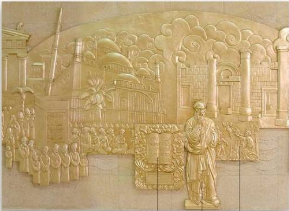
古希伯来法典（十戒）