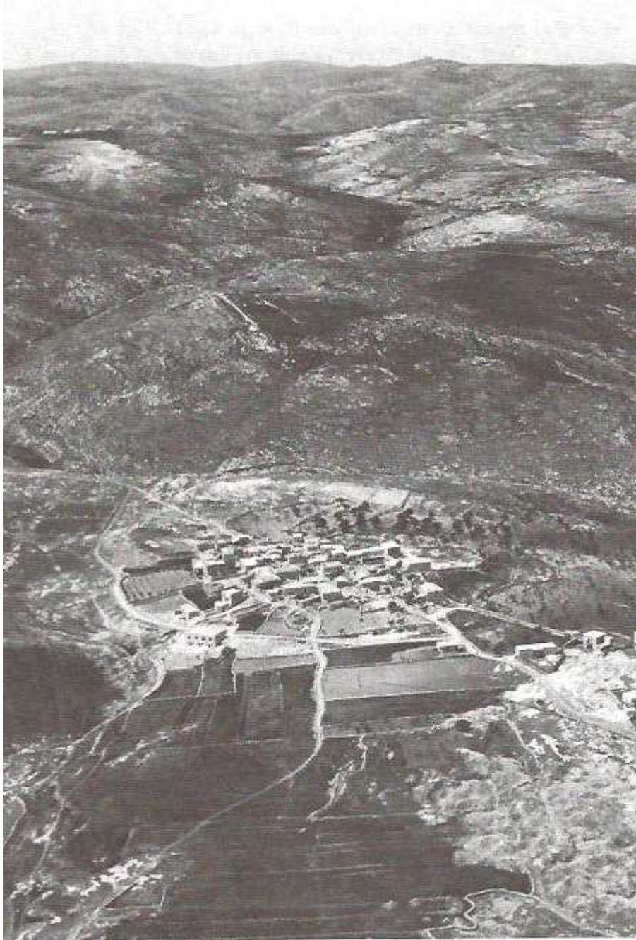
鸟瞰亚拿突（现今的 Anata），先知耶利米的故乡，在耶路撒冷东北方 2.5 英里。