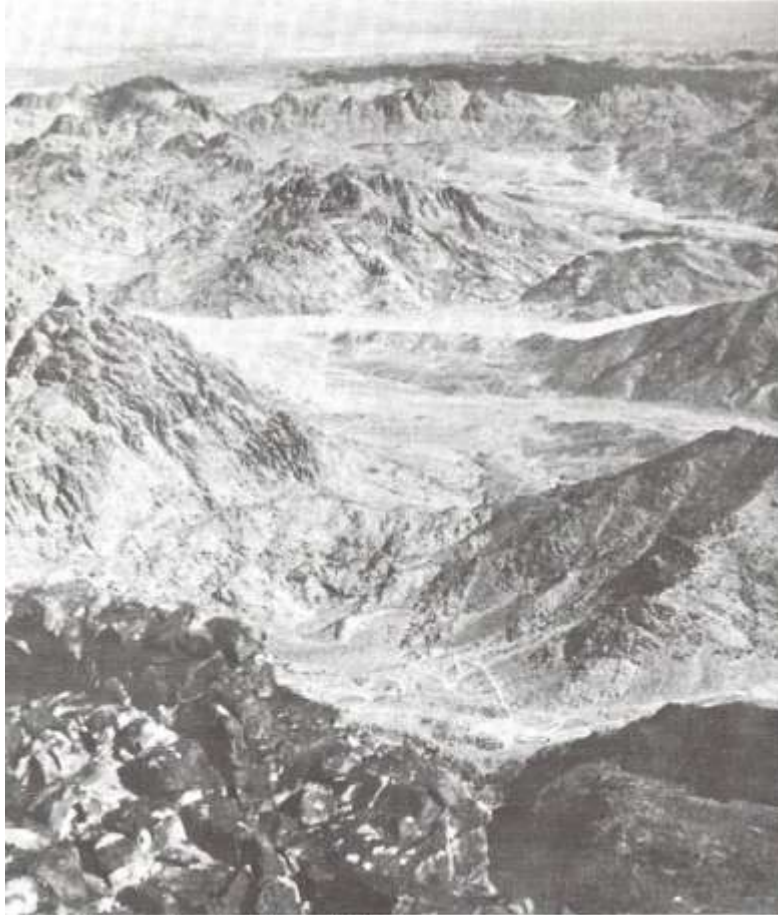
从西奈山坡上观看崎岖的山地。