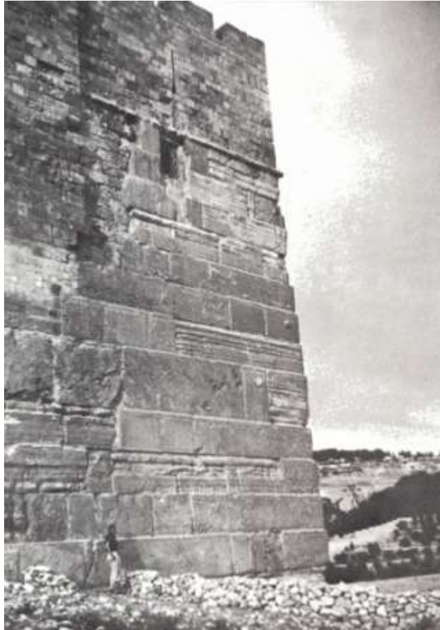
耶路撒冷旧城城墙之东南角。