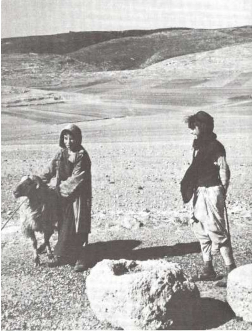
提哥亚附近一个多石、少草的山坡上的羊和牧童。