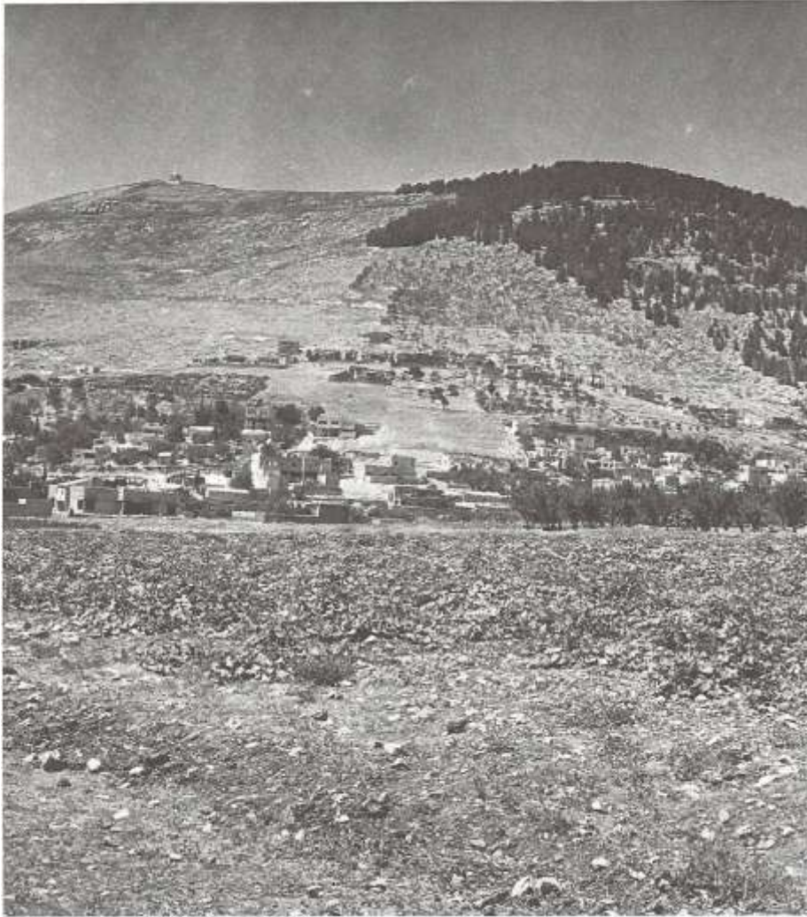
基利心山，位于撒玛利亚境内。