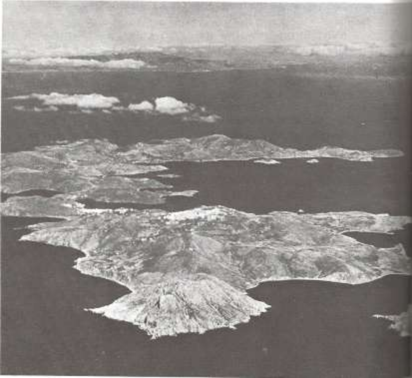
拔摩岛，使徒约翰被流放之地。