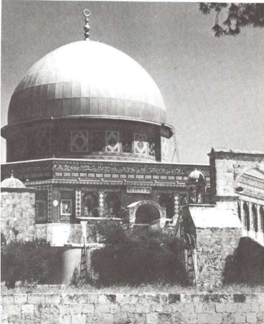
公元 691 年建于所罗门圣殿原址的圆顶清真寺之今貌。