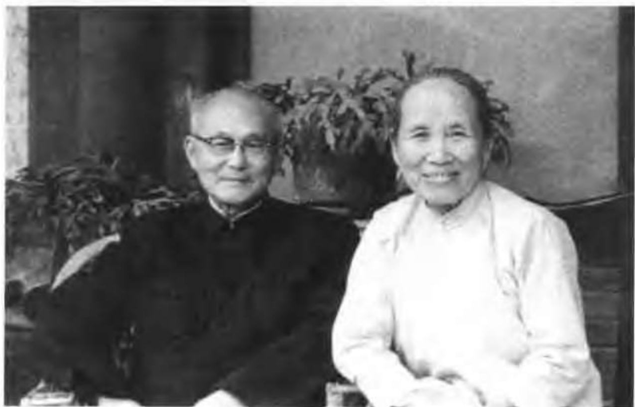
解放初期的赵紫宸夫妇